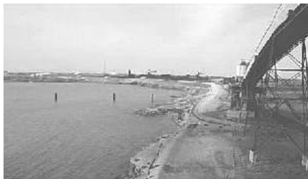
Panorámica del puerto y la mina de Carbones del Cerrejón LLC

A propósito del traslado a Bogotá, de empresas de la talla de Carbones del Cerrejón LLC y Fedco, se hace urgente cuestionarse qué motiva la migración empresarial, y qué pasa con el atractivo y las condiciones que ofrece Barranquilla como sede para la inversión.