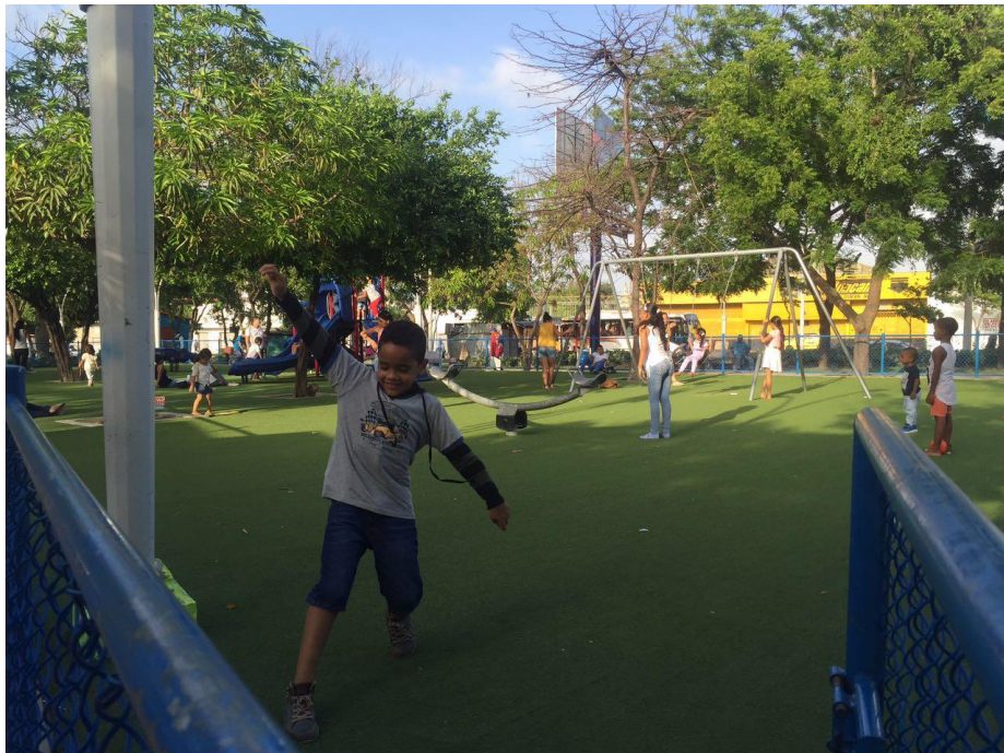
Anexo 2. Parque El Universal Zona Infantil