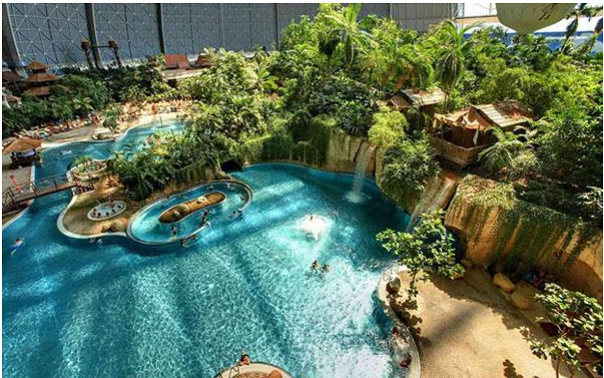
Ilustración 7. Tropical Island Resort – Alemania

En México y América Latina abundan los manantiales termales y alrededor de ellos se construyeron puestos de alimentos y hospedaje. En Orlando, Florida, apareció el primer parque acuático: Wet'n Wild, construido por un veterano de parques George Millay (1977). Al mismo tiempo, México, Asia y Europa desarrollaron toda una industria alrededor de los juegos y atracciones de agua.