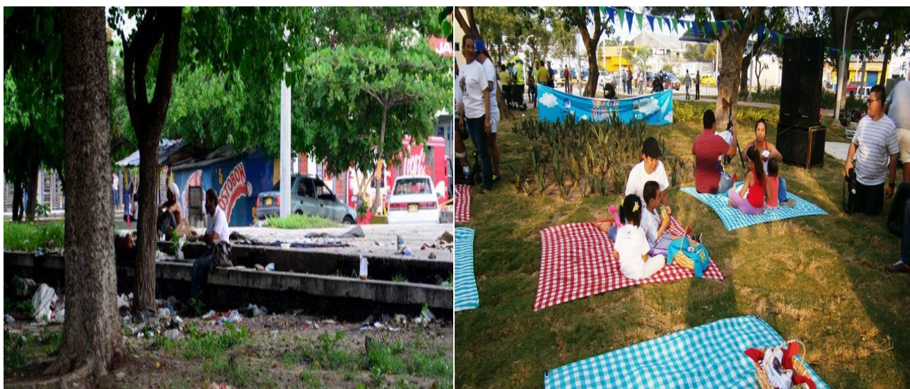
Ilustración 10. Parque el Universal, antes y después. Es el segundo más grande con sus 28.500 metros cuadrados, solo superado por el Sagrado Corazón, que mide 36.000. Se extiende entre las carreras 34 y 37 y las calles 45 (Murillo) y 47, justo enfrente del cementerio del que terminó derivándose el nombre con que es conocido, que data de 1870 pese a que originalmente fue la 'Plaza Concordia'.

Cuenta con los espacios necesarios para ejercer todo tipo de actividades, desde los deportes hasta algo calmado como leer un libro.