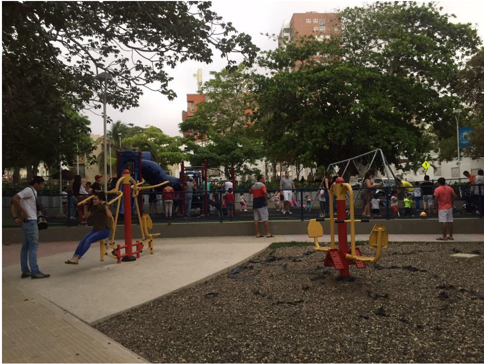
Anexo 5. Parque El Universal Zona Física