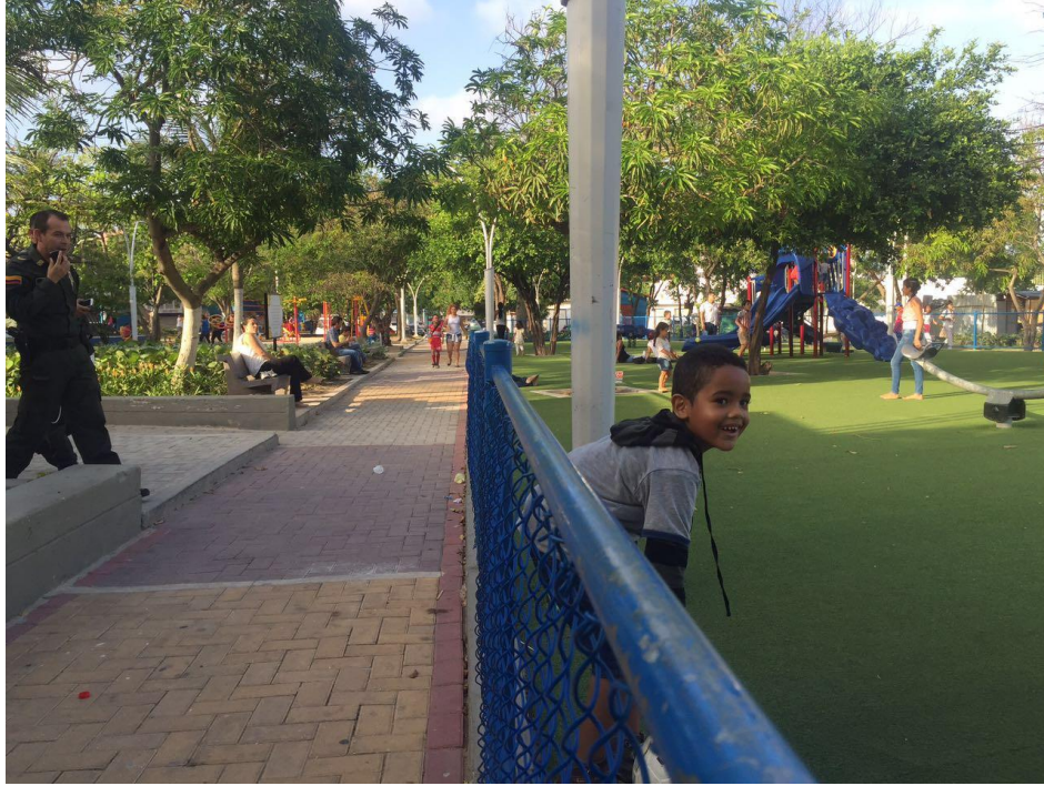
Anexo 1. Parque El Universal Zona Infantil