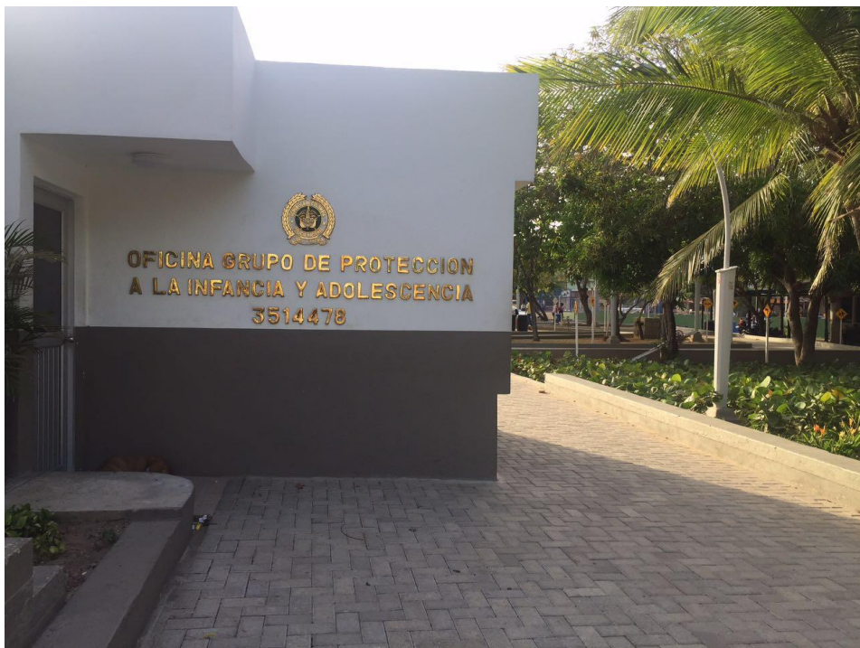
Anexo 6. Parque El Universal Policía de Infancia y Adolescencia, CAI