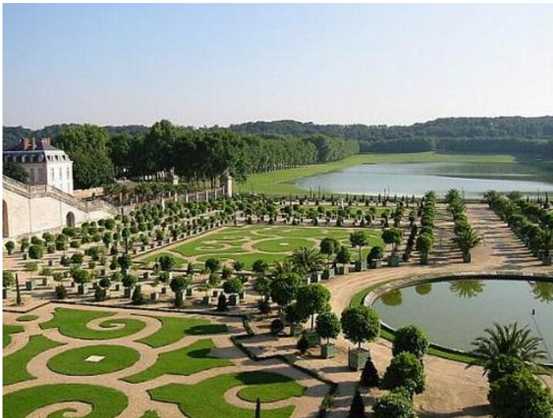
Ilustración 1. Jardines de Versalles. El parque del Palacio de Versalles se extiende sobre más de 800 ha. En este parque totalmente cerrado, se encuentran varios monumentos y curiosidades que hacen la fama del Castillo de Versalles a parte del Palacio: “L’Orangerie” (El invernadero de naranjos), el gran canal, los jardines a la francesa, los estanques, y el dominio de la Reina que consta del pequeño Trianon y del grande Trianon a lo lejos en el Gran Parque.

Los parques surgen en el mundo luego de un emergente cambio social y político en la edad media que da lugar a estos amplios lugares con densa vegetación con la finalidad de ser espacios multifuncionales que aportan con sus elementos multitud de efectos positivos al medio que le rodea.