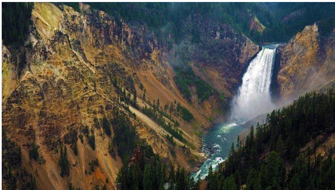
Ilustración 5. Parque Yellowstone

Parques naturales: Los parques naturales son áreas al aire libre que, por sus particularidades en cuanto a la biología, son custodiadas de manera especial por el Estado. En los parques naturales existen diversas limitaciones al accionar humano, para la conservación de su fauna y flora. Yellowstone, fue el primer parque nacional del mundo. El 1ro de marzo de 1892 el congreso de los Estados Unidos aprueba por ley la creación de este parque nacional (Medeiros, 2006).