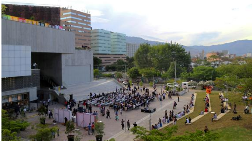
Ilustración 2. Parque Lineal el Río en Medellín. No tiene mayores atractivos históricos y culturales, pero en su zona sur hay construcciones aptas para practicar deportes como bicicleta,

Los parques urbanos producen un ahorro significativo a la sociedad puesto que los ciudadanos dedicados a la revitalización y cuidado de sus parques crean comunidades más seguras, frenan los costos asociados con los servicios públicos, tales como la protección contra incendios, la policía y reparación. Los ahorros ambientales también son significativos, los árboles y la vegetación en parques urbanos ofrecen soluciones naturales de un menor costo para hacer frente a la contaminación del aire.