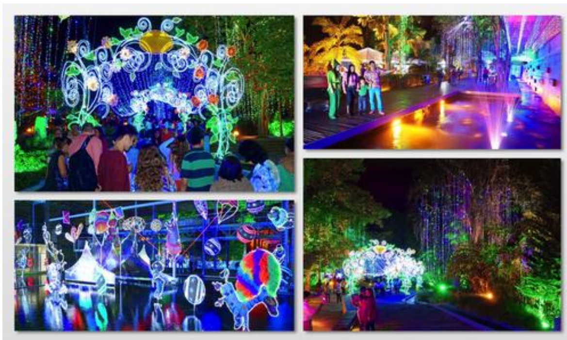
Ilustración 3. El parque del agua en Bucaramanga es uno de los parques más reconocidos de la ciudad bonita; está disponible para ser visitado en todo el año, pero particularmente en diciembre ofrece una gran atracción navideña como lo es una iluminación de la época en todo el parque, con pesebres y arbolitos emblemáticos. La entrada a este lugar tiene costo.

Las zonas verdes urbanizadas tienen un papel muy importante en temas de salud pública puesto que en ellas, las personas tienen la oportunidad de realizar actividades físicas como correr, caminar o participar en otras actividades que mejorarán en gran medida su salud.