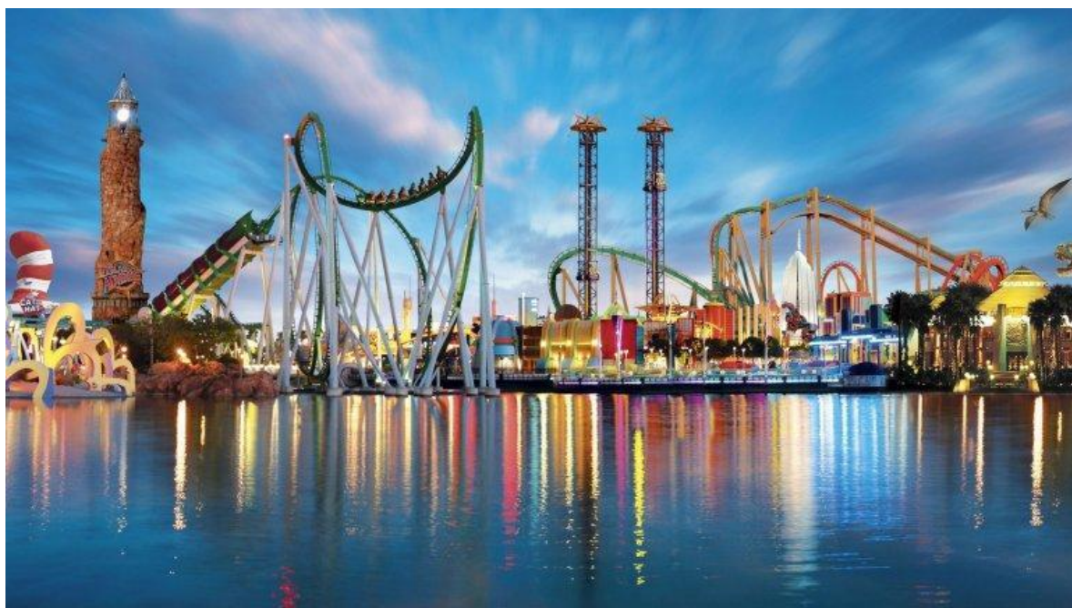
Ilustración 6. Sea Lion Park

El establecimiento de Boynton, el famoso "Sea Lion Park", pronto fue acompañado por otros parques de atracciones, de los que los más famosos fueron el "Steeplechase Park" y el "Luna Park", verdaderos mitos del género. A finales del siglo XIX, pues, el modelo estaba firmemente establecido. El siglo XX lo completaría con más y más tecnología al servicio de la diversión pura. Aparecerían los famosos "rides" y "roller coaster", las conocidas "montañas rusas", y las atracciones basadas en los efectos de la aceleración sobre el cuerpo humano. Una nueva manera de divertirse, apoyada en una tecnología tan compleja como invisible, se imponía. Los nuevos paraísos habían nacido.