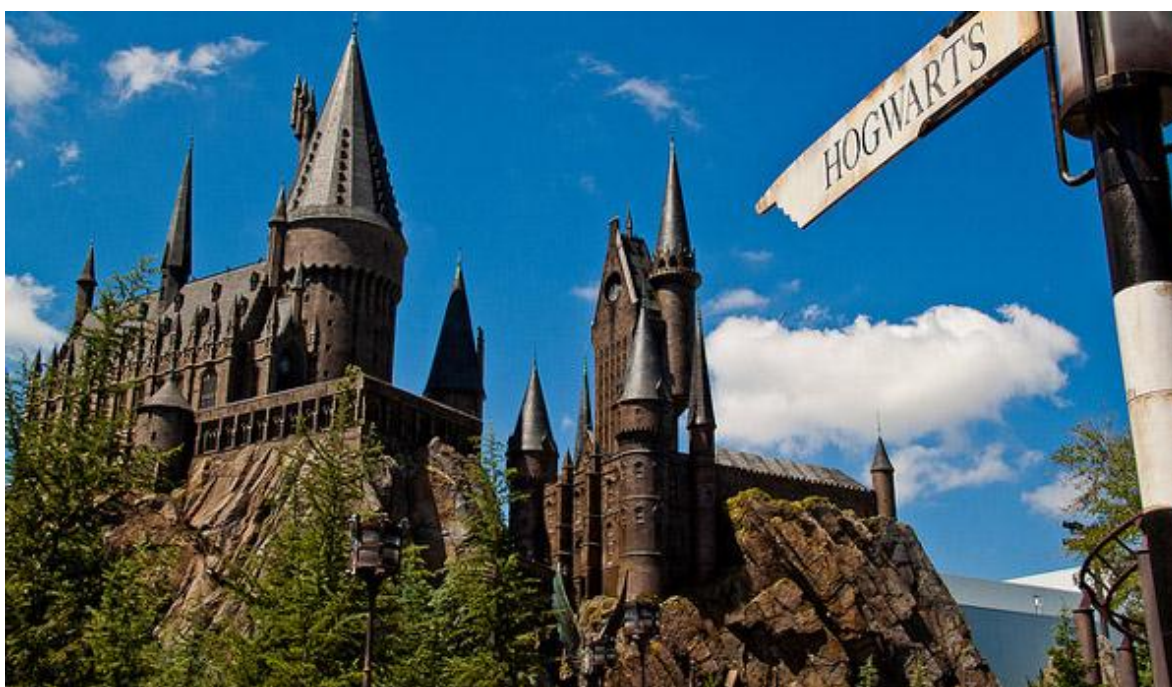
Ilustración 8. Parque temático Harry Potter en Londres

Un parque temático con un buen diseño tanto estructural como cultural, genera sostenibilidad económica tanto para sus promotores como para el territorio en el que yace, es decir, esta clase de parques contribuyen a aumentar el nivel sociológico y administrativo de la ciudad.