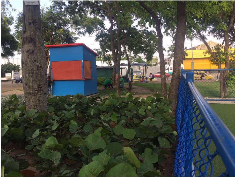
Anexo 3. Parque El Universal