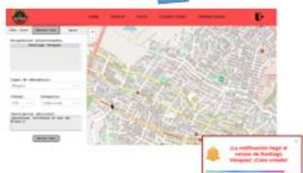
Generation and allocation of cases