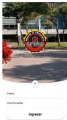
Brigade User's login