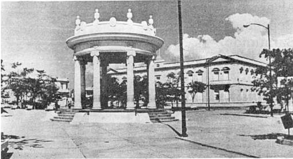
El templete estilo republicano de la plaza principal de Ciénaga, punto de referencia en Los cuentos de Juana .

del autor, de una amistad que no cegaba en nada la distancia crítica que se requiere para ver las producciones literarias.